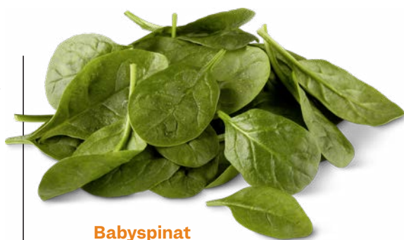
Babyspinat «Aus der Region» 200 g Fr. 3.95